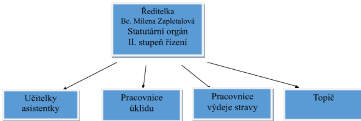
Schéma 1: Organizační schéma MŠ Držovice